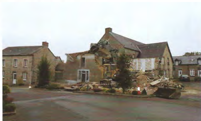
Acquisition et démolition maison Chevron 28 597€