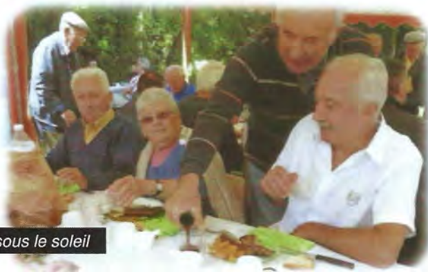
Le repas champêtre sous le soleil