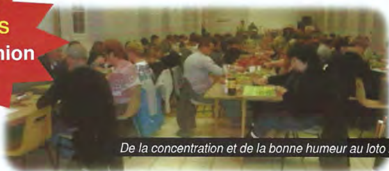
De la concentration et de la bonne humeur au loto 2017