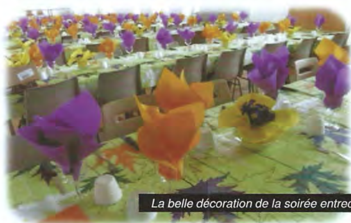
La belle décoration de la soirée entrecôte

Toute l'équipe du Comité des Fêtes vous remercie pour votre participation, pour toute cette convivialité, prouvant qu'une petite commune peut rester dynamique.