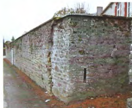
Réfection mur de soutènement de la Mairie