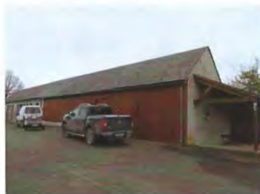
Réfection toiture du préau et du garage