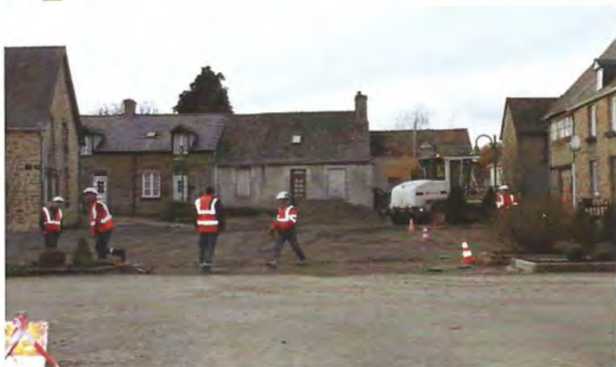
Réfection de la Place de l'église et Impasse de la Petite Cour : 29 482€