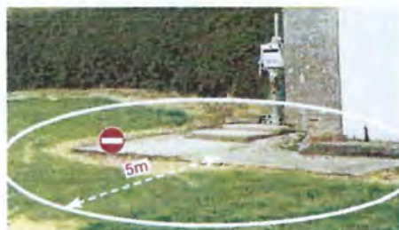
les sources, forages et puits