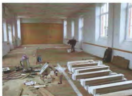
Remplacement du parquet de la salle des fêtes : 7 572€