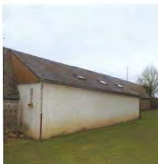
Réfection toiture des vestiaires du terrain de foot