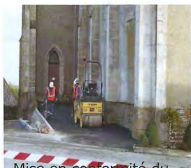
Mise en conformité du paratonnerre et accessibilité de l'église : 5 507€