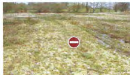
les zones humides