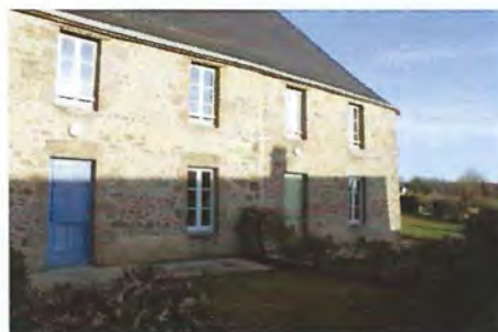
Peinture des portes et fenêtres des appartements de l'ancien presbytère : 2 400€